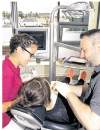
Mit Aussicht auf den Hafen ist man selbst beim Zahnarzt gut abgelenkt.

Elf Fachleute gehören jetzt zum Team. „Die meisten davon sind schon seit Anfang an